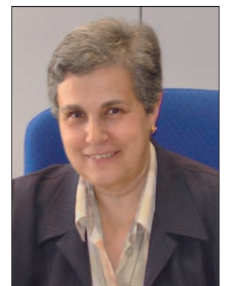
Mª ANTONIA CASANOVA Inspectora Central de Educación

Como, además, la calidad educativa de la que tanto se habla es algo deseable para el conjunto de la población, hay que apostar por una escuela inclusiva en la que se ofrezca de verdad igualdad de oportunidades, y en la que seamos capaces de compartir educando lo mejor de cada integrante de la comunidad educativa. Haré una afirmación que puede resultar tajante: la escuela inclusiva es la única alternativa que ofrece educación